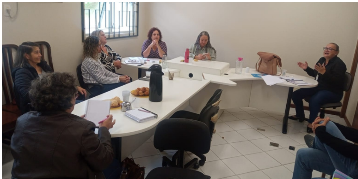
Reunião de reordenamento em Campo Alegre