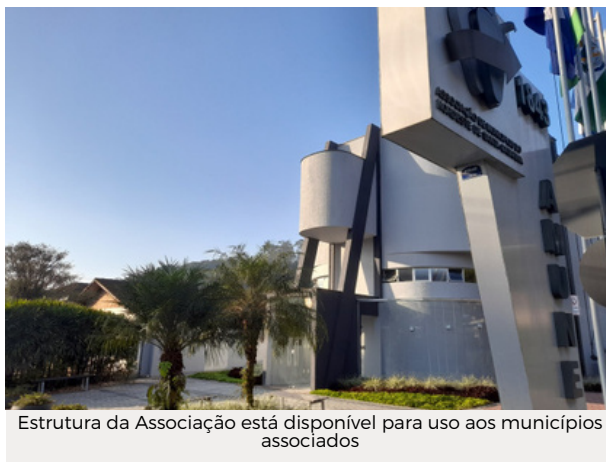
Estrutura da Associação está disponível para uso aos municípios associados

Estudos sobre os impactos e a viabilidade do Projeto de Reconfiguração da Região Metropolitana de Joinville (RMJ), envolvendo todos os municípios associados, começaram a ser viabilizados pela Amunesc em 2021. Toda a tramitação contou com a parceria da Agência Francesa de Desenvolvimento (AFD).