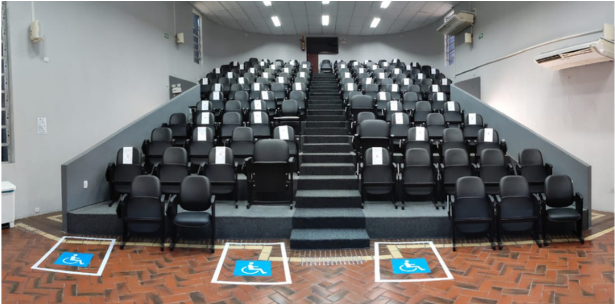
Auditório da Amunesc oferece espaço amplo e confortável para a realização de eventos

Para se tornar um espaço cada vez mais acolher e inclusivo, ao longo do ano, as instalações prediais da Amunesc passaram por diversas alterações a fim de atender requisitos de acessibilidade para diferentes necessidades especiais.