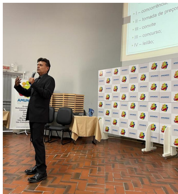
Auditório da Amunesc oferece espaço amplo e confortável para a realização de eventos

O espaço tem sido bastante procurado, especialmente no pós-pandemia, quando grande parte dos eventos começaram a ser retomados. A prova disso é que em 2022 o auditório da Amunesc foi utilizado mais de uma centena de vezes.