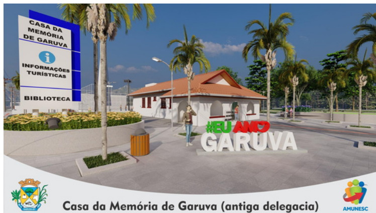
Casa da Memória de Garuva (antiga delegacia)

Os municípios associados receberam 16 projetos, que totalizam 42 disciplinas simultâneas, para o Turismo, Cultura e Lazer. Estão inclusas construções novas, reformas e demais assessorias técnicas.