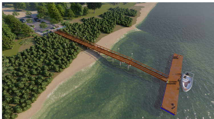
TRAPICHE BARRANCOS - GARUVA

7 PRAÇAS 1 PARQUE 3 TRAPICHES PÓRTICO CASA DA MEMÓRIA