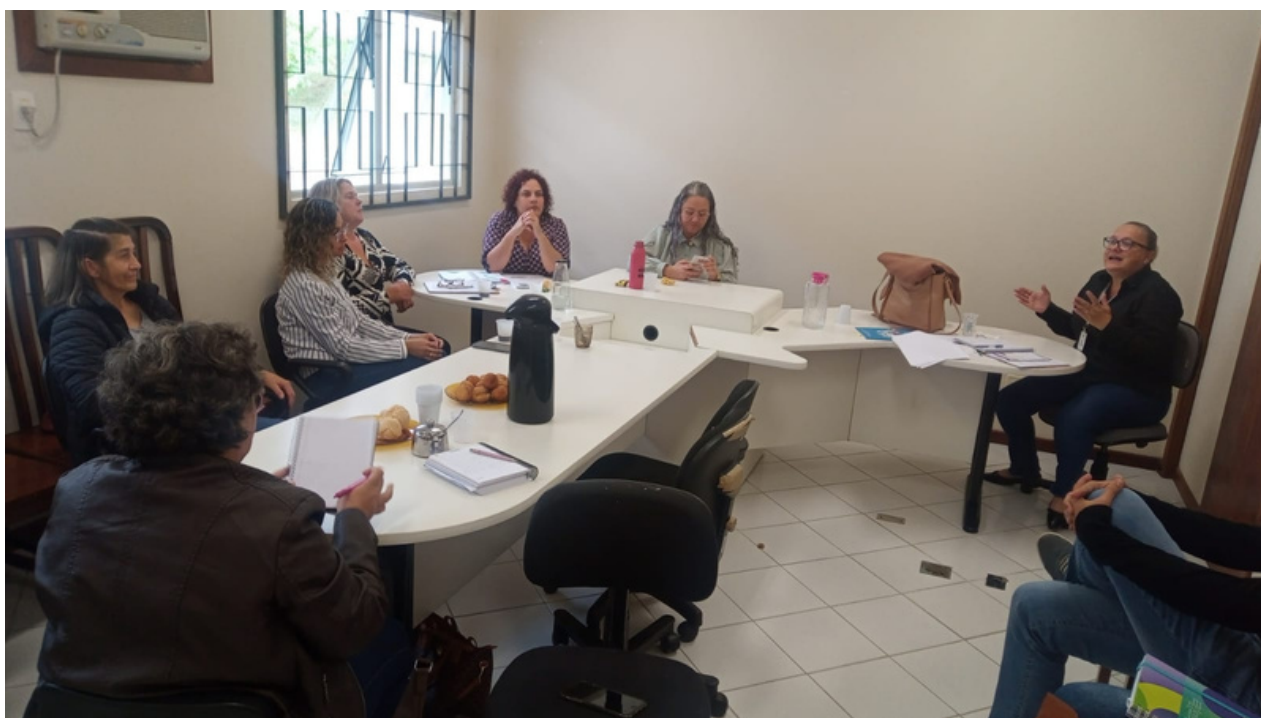
Reuniões de reordenamento foram realizadas em Campo Alegre

A oferta de serviços da Rede de Proteção possui fluxos e quadro de recursos humanos definidos por parâmetros que visam facilitar o acesso do usuário dos serviços a fim de promover a validação de seus direitos.