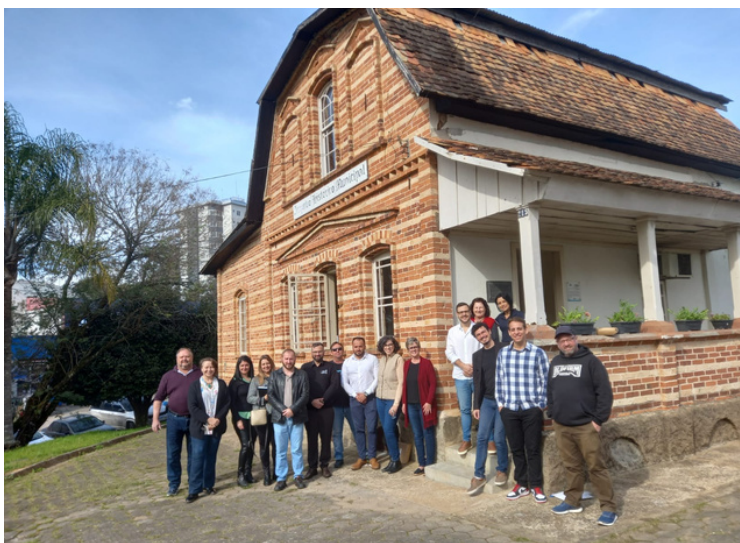
Reunião do Colegiado e Encontro dos Profissionais de Museus e Espaços de Memória no Museu Dr. Felipe Maria Wolff de São Bento do Sul.

Assim como o constante fortalecimento do planejamento estratégico com foco na integração regional.