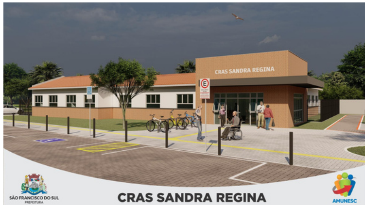
CRAS SANDRA REGINA

CRAS 2 CREAS SEMINÁRIO CENTRO POP CENTROEVENTOS C MARA