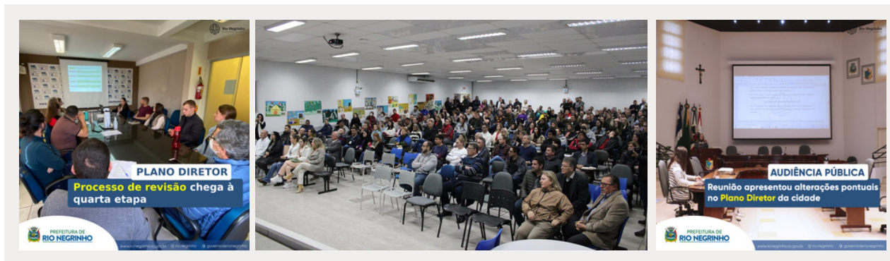
Reuniões presenciais - Plano Diretor municípios

Ao todo foram assessorados 4 municípios na revisão e atualização dos Planos Diretores Municipais.