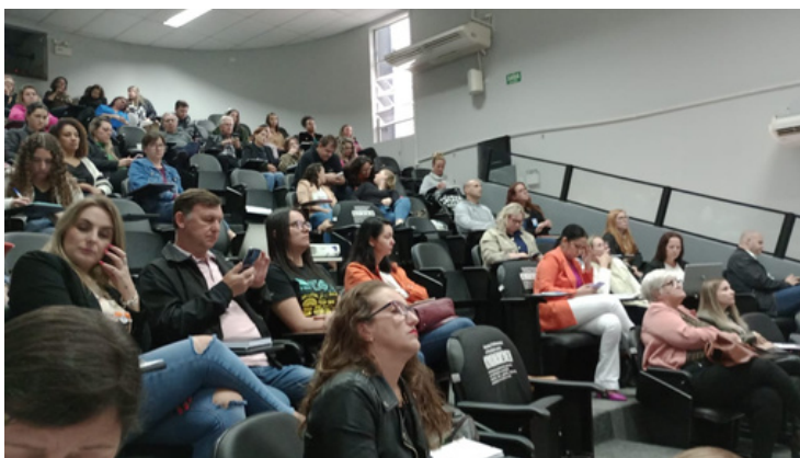
Escuta Especializada no auditório da AMUNESC