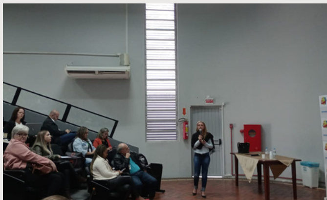
Apoio Técnico do Estado aos municípios

Indicação de palestrantes aos municípios associados;