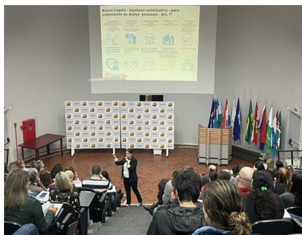
Servidores de Joinville participaram de um treinamento sobre a Lei Geral de Proteção de Dados (LGPD)