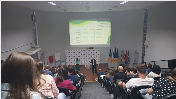
Capacitação em Meio Ambiente oferecida pela Fecam, em parceria com a Consema

Nas reuniões bimestralmente, a equipe abordou diversos temas e capacitações, entre eles: