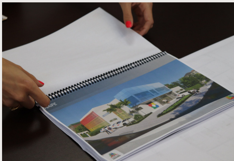
Registro da apresentação - Projeto NAIPE (Joinville)

A atuação da Equipe Administrativa e Técnica Engenharia, Arquitetura e Urbanismo vem, ano após ano, contribuindo para a melhoria da qualidade de vida das pessoas nos municípios de abrangência da Amunesc.