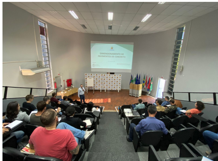
Evento Rodovias e Vias Urbanas: Projeto e Dimensionamento