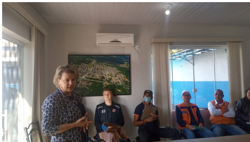
Reunião - mobilização para enfrentamento de calamidades

Um dos marcos da atuação do Colegiado da Assistência Social, em parceria com a Defesa Civil, foi a mobilização para o enfrentamento das situações de calamidade decorrente de fortes chuvas que assolaram a região.