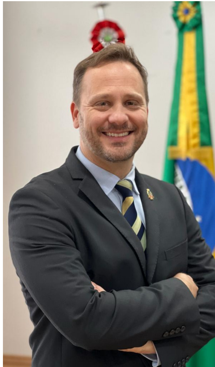
ADRIANO SILVA PRESIDENTE AMUNESC | PREFEITO DE JOINVILLE

Para 2023, cabe a todos nós unirmos esforços pelo trabalho conjunto, a exemplo da participação ativa da Amunesc no detalhamento das diretrizes da região metropolitana. Essa é uma conquista importante que nos atribuirá ainda mais força para o desenvolvimento de políticas públicas conjuntas.