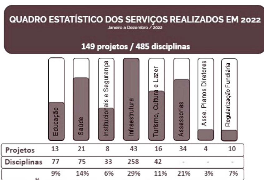
QUADRO ESTATÍSTICO DOS SERVIÇOS REALIZADOS EM 2022

De janeiro a dezembro de 2022, 149 projetos foram entregues, totalizando 485 disciplinas. Veja no gráfico a seguir