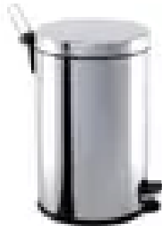
Acabamento Inox Polido Lixeira Inox Com Pedal e Balc