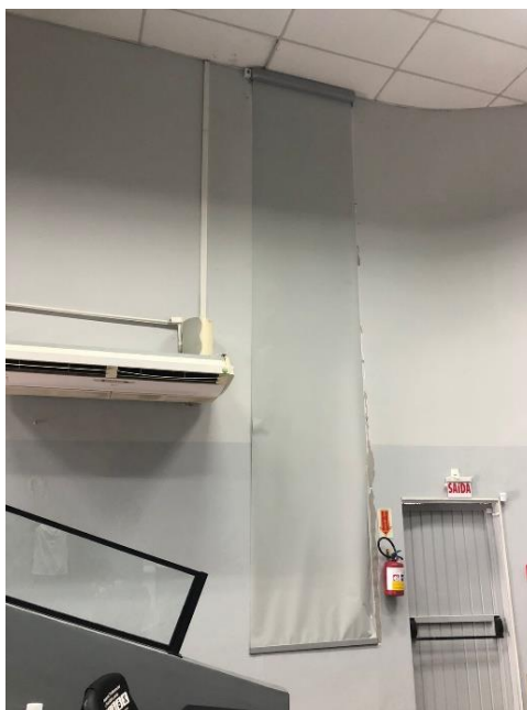
Foto 5: Paredes do auditório danificada pela instalação da cortina